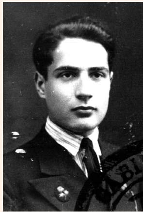
• François Mitterrand à l'époque du baccalauréat