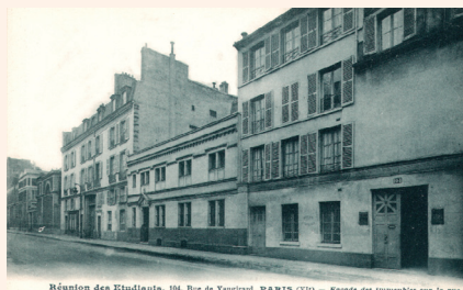
• L'entrée du foyer des étudiants du « 104 », rue de Vaugirard à Paris