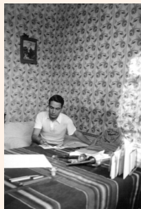
• François Mitterrand dans sa chambre d'étudiant au foyer du « 104 »