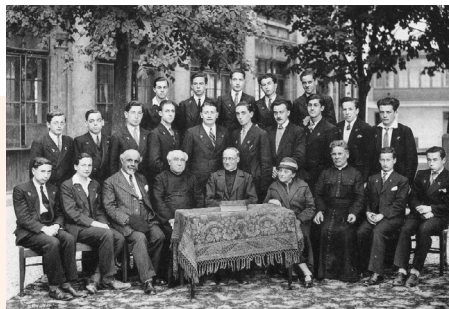
• François Mitterrand en classe de première à Saint Paul, troisième à gauche du dernier rang