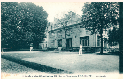
• Le tennis derrière le réfectoire du « 104 »