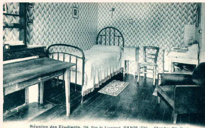
• Une chambre du foyer